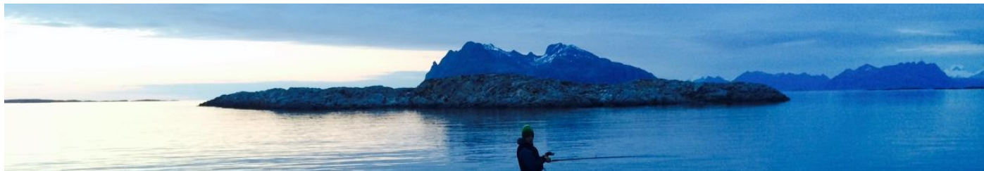
Motiv fra nordlige Nordland.